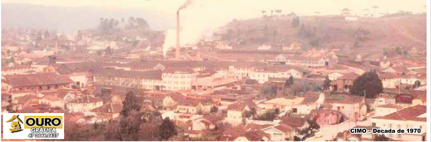
CIMO – Década de 1970

Esta publicação, que mostra os 70 anos de atividades da Móveis Cimo em Rio Negrinho, além de resgatar grande parte da história da nossa cidade, tem também a intenção de, 35 anos depois, fazer uma justa homenagem, aos milhares de trabalhadores que passaram pela CIMO, deixando sua contribuição através de seu trabalho, de sua dedicação, de sua lealdade e acima de tudo, deixando seu exemplo de cidadão do bem.