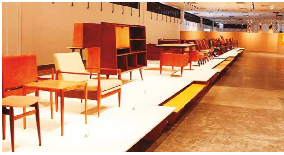
Móveis produzidos pela CIMO

sequências de pré e pós guerra. Sobressaiu-se de modo crescente de muitos desastres como incêndios, explosão de caldeira, ausência, quase total, de moeda circulante, azares em negócios, mudanças – e isso naqueles tempos de antigamente – de vários empreendimentos industriais. Tudo isso, e muito mais foi vencido.