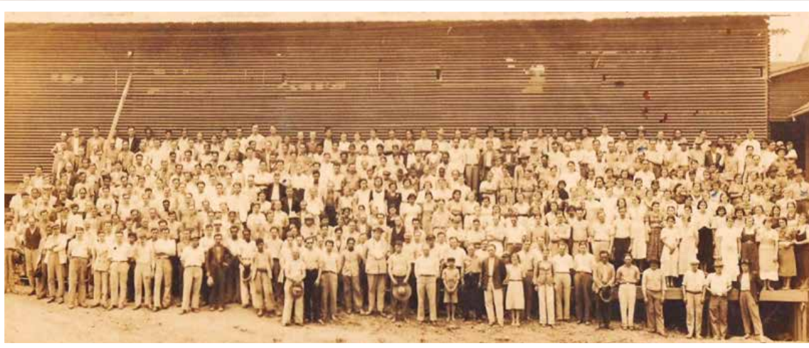
Funcionários da Móveis Cimo na década de 1930