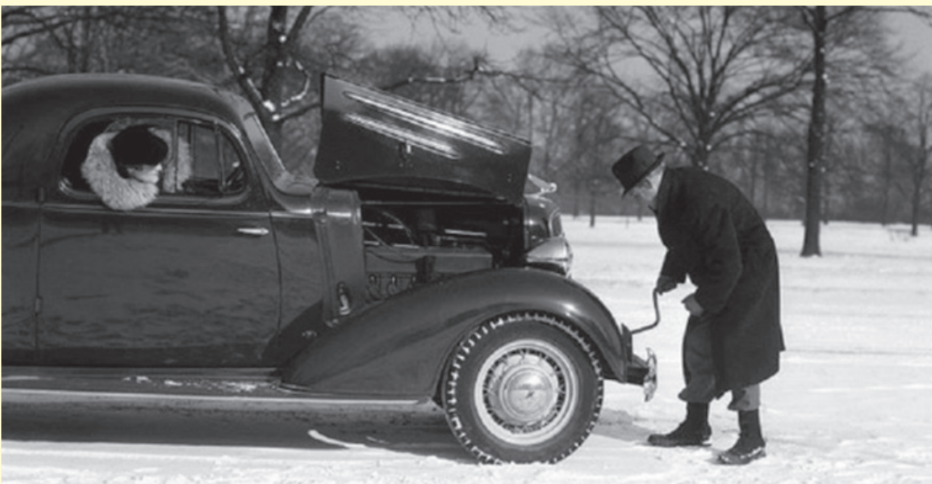
Os primeiros carros funcionavam à base de magneto para alimentação da bobina e das velas, sendo que a partida era feita à base de manivela.