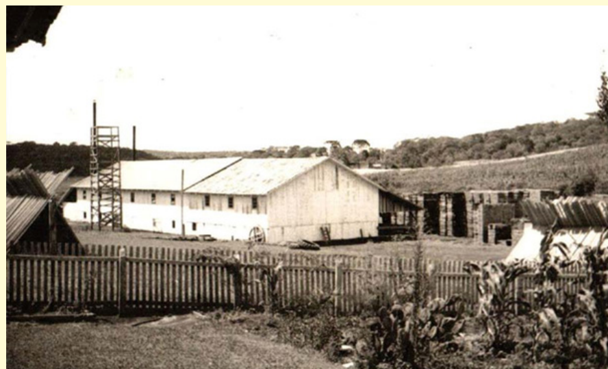
A fábrica foi inaugurada em 1971

A Móveis Rueckl funcionou até o início de 2011, gerando centenas de empregos, mas sem dúvida, desde o começo dos seus empreendimentos, a família Rückl deixou uma grande marca na comunidade, onde por mais de 70 anos, contribuiu ativamente no desenvolvimento e na história de Serro Azul.