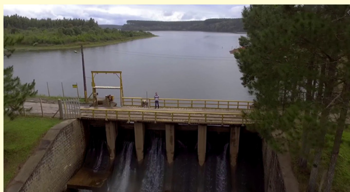
Comportas da represa que canalizam a água para o Rio Preto