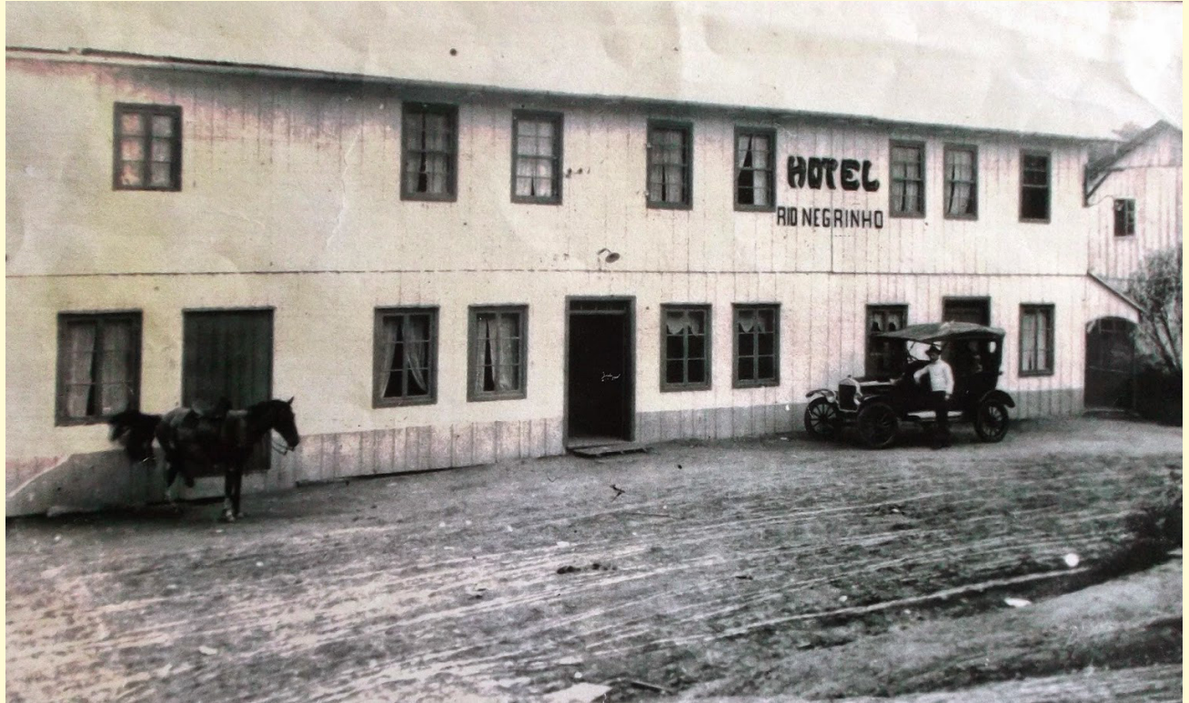
Hotel Rio Negrinho - Década De 1910

Porém com a construção da Estrada Dona Francisca, iniciada no final dos anos 1850, começaram a vir outras famílias para Rio Negrinho, pois em 1880, a Estrada Imperial Dona Francisca passou por Rio Negrinho e a empresa do Engenheiro Riques montou acampamento junto à obra. Neste ano, instalaram-se ao longo do traçado da estrada em Rio Negrinho, várias famílias provenientes de Lençol e do interior da região.