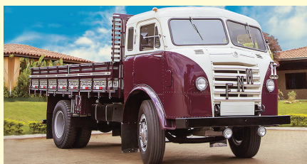
FNM D-9500 - 1958 – ALFA ROMEO

Os veículos de carga nacionais têm uma longa história, que começou com a FNM - Fábrica Nacional de Motores, que era uma empresa estatal e foi a pioneira ao inaugurar, uma linha de montagem de caminhões genuinamente brasileiros, resultando no primeiro caminhão fabricado no Brasil em 1958, o FNM D-9500, com mecânica Alfa Romeo.