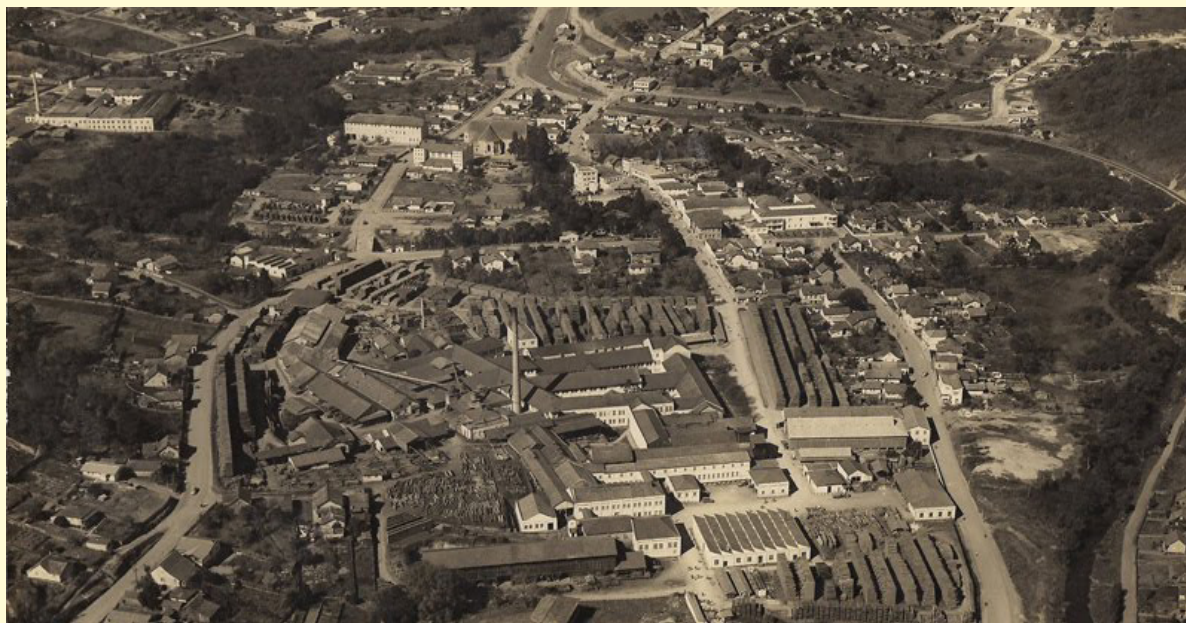
Vista aérea - Década 1960

Estas pessoas, portanto, são os desbravadores e os pioneiros da emancipação política de Rio Negrinho, que aconteceu em 30 de dezembro de 1953.