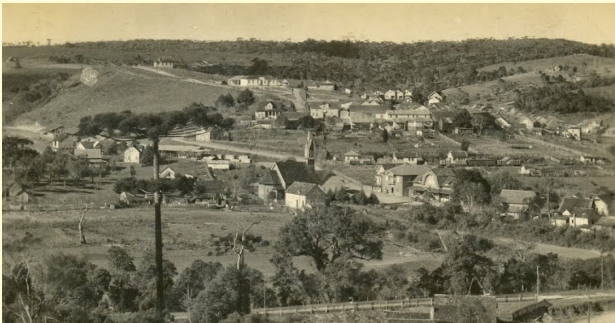
A cidade de Rio Negrinho na década de 1940