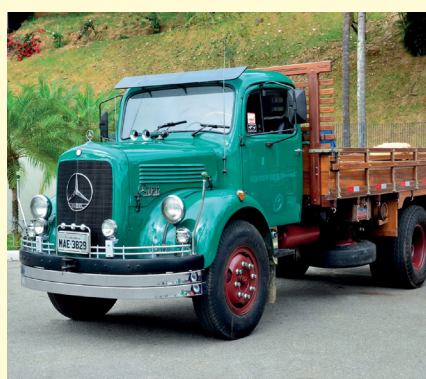
MERCEDES BENZ 1957

A Mercedes Benz, empresa mundialmente conhecida na área de veículos de carga e passageiros, instalou-se também no Brasil. Seus primeiros caminhões datam de 1957, com grande percentual importado. Mas, aos poucos, esse caminhão foi se impondo, mercê de inegáveis qualidades e principalmente devido ao alto padrão de assistência técnica de que sempre desfrutou.