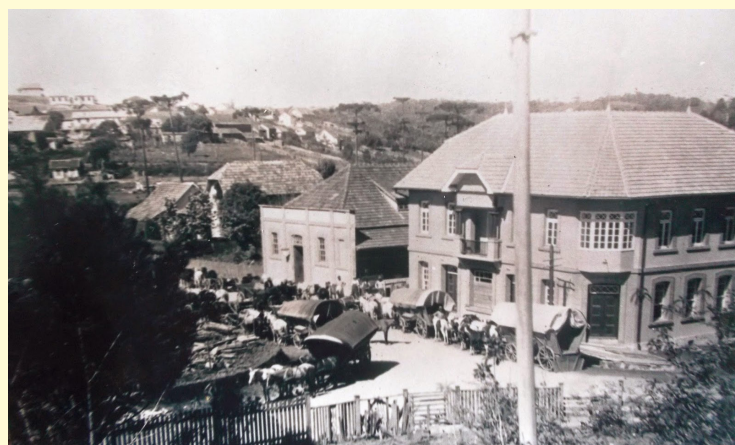
O movimento de carroças era intenso

O Alto Rio Preto, onde antes só se podia chegar pela Estrada dos Gabardos e trilhas de tropeiros, também se abriu diretamente a Rio Negrinho, que assim se tornou um centro comercial de madeiras e erva mate.