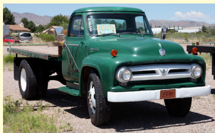
FORD F-600 - 1957

A Ford lançou em agosto de 1957, o F-600 com motor V8 de 4,5 litros à gasolina, com 161 cv de potência e capacidade de 6,5 toneladas. Saiu da linha de montagem fábrica da Ford em São Paulo, com índice de nacionalização de 40%. Até então, os veículos eram montados no Brasil com peças importadas dos Estados Unidos.