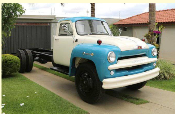
CHEVROLET C-6500 - 1958

O Chevrolet Brasil C-6500, foi o primeiro caminhão GM produzido no Brasil. O nome Chevrolet Brasil se deve ao fato de ser o 1º modelo produzido no mercado brasileiro. Os logotipos do modelo traziam um mapa do Brasil em seu interior.