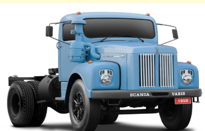
SCANIA L-75 - 1958

Outra empresa que introduziu novidades no panorama brasileiro dos transportes, a partir de 1957, foi a Scania Vabis do Brasil, com seus caminhões pesadíssimos e chassi para ônibus com suspensão pneumática.