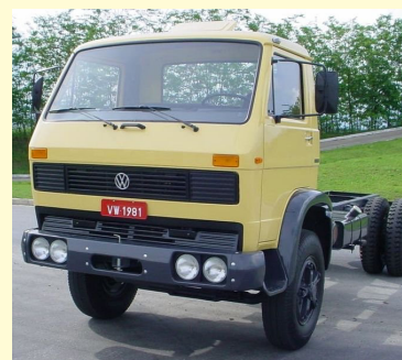
CAMINHÃO VW - 1981

Sua entrada no mercado de veículos comerciais, aconteceu com enorme sucesso, chegando a ultrapassar a aparentemente invencível Mercedes-Benz nos segmentos médio e semipesado.