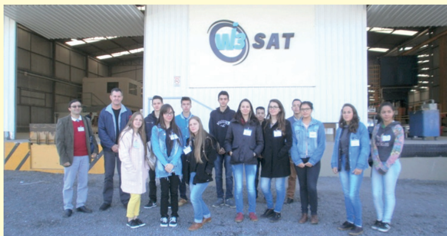
Visitas a empresas fazem parte do conteúdo do Módulo - Iniciação ao Mundo do Trabalho. Nesta oportunidade, os alunos conheceram a Empresa W3/SAT, que gentilmente abriu suas portas, para que todos pudessem ter um primeiro contato com uma empresa e ver como acontecem seus processos de produção.