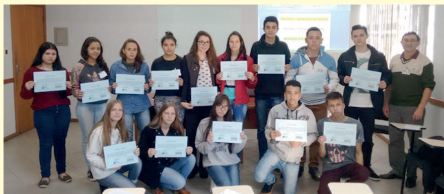
Os Certificados de Conclusão dos cursos do Projeto Aprendiz do Brasil são válidos em todo o território nacional.

distância, através de cursos on-line e com Certificados de Participação, também válidos em todo o território nacional. Maiores informações sobre o projeto podem ser obtidas pelos telefones: 47 3644-3000 e 9.8882-5419 (WhatsApp).