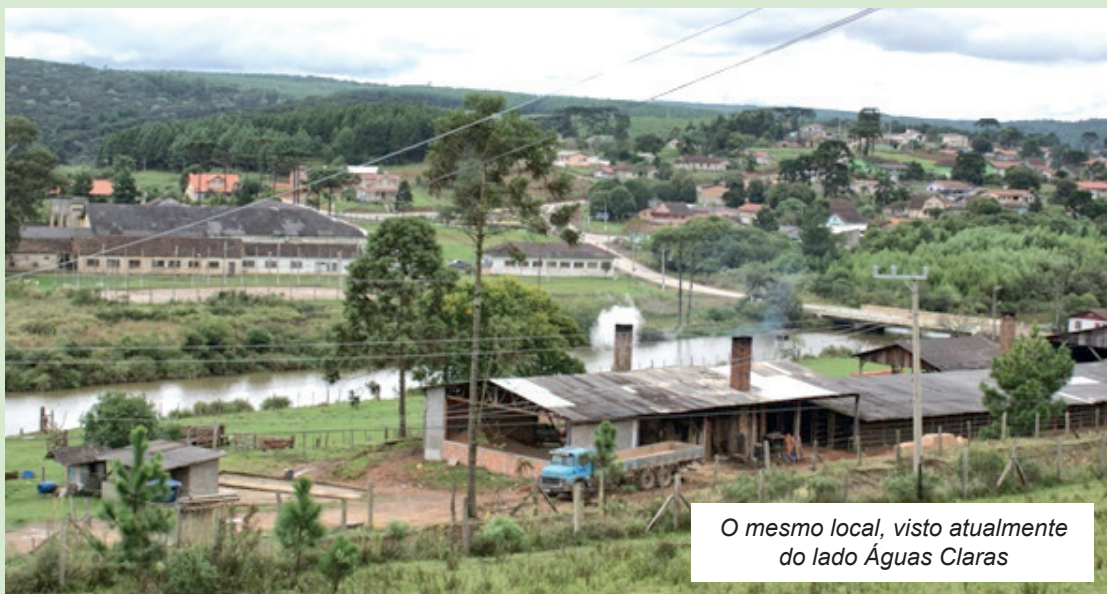
O mesmo local, visto atualmente do lado Águas Claras

A história registra que Volta Grande começou em Águas Claras, quando ainda era município de Mafra, pois as terras de Rio Negrinho ainda pertenciam à família Cardoso, que aos poucos foi vendendo suas propriedades.